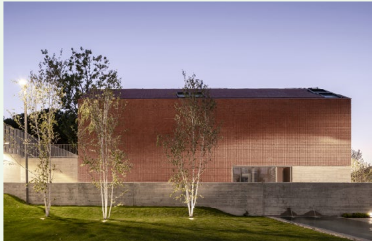
Cuatro variantes de villa en Madrid Arq. De Lapuerta + Campo Arquitectos

Por otro lado, para limitar el riesgo de propagación exterior del incendio, las fachadas colindantes con otras fachadas o cubiertas pertenecientes a distintos sectores y zonas o a distintos edificios , deberán tener una resistencia al fuego, EI, igual o superior a EI60, al menos en una franja con una anchura mínima establecida en el SI2. Adicionalmente, debe comprobarse que se cumplen las distancias y alturas establecidas en el SI2 para aquellos elementos de la fachada que presenten una resistencia al fuego menor de EI60, como son los huecos de ventanas y puertas.